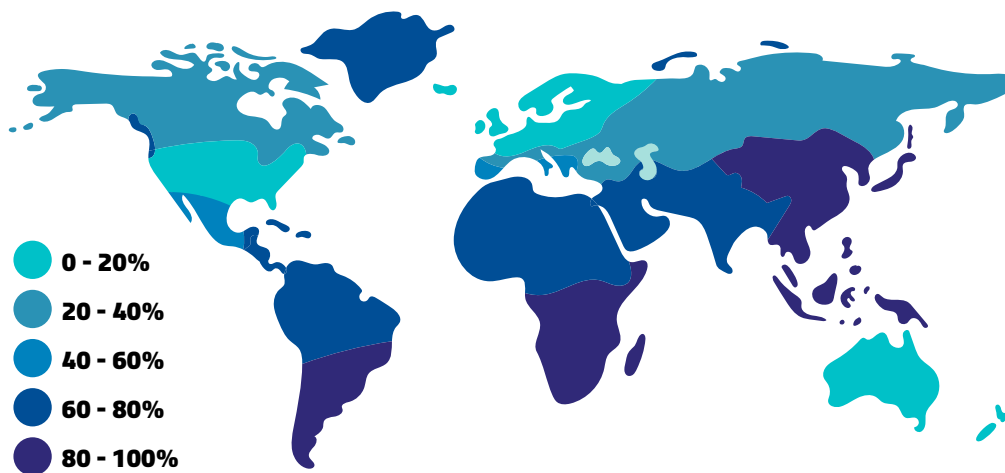
Figuur 2. Wereldwijde prevalentie (%) van lactose-intolerantie.

Het is niet makkelijk om cijfers te geven over de prevalentie van lactose-intolerantie in Nederland. Inschattingen variëren van 2% tot 12%. Deze variatie kan door verschillende factoren verklaard worden. De meeste gevallen van lactose-intolerantie zijn alleen gebaseerd op zelfrapportages op basis van klachten. De klachten die lactose-intolerantie geeft, zijn echter niet specifiek voor lactose-intolerantie. Ze komen ook voor bij andere aandoeningen aan de darm zoals prikkelbare darm syndroom. De beste manier om lactose-maldigestie vast te stellen is de waterstofademtest. Op basis van de waterstofademtest komt de prevalentie van lactose-intolerantie lager uit. Hier moet wel genoemd worden dat niet iedereen met lactosemaldigestie uiteindelijk wordt getest. Daarnaast zijn er verschillen in prevalentie tussen verschillende bevolkingsgroepen. Bij mensen met een West-Europese achtergrond komt lactose-intolerantie tot ongeveer 10% voor terwijl de prevalentie op kan lopen tot 90% bij mensen met een Oost-Aziatische achtergrond. 3